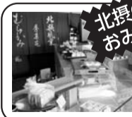
北摂のおみやげ処!!

「秀菓苑 むらかみ」 無花菓が名産の川西市、「いちじくの里、いちじくの餅」など 地元食材にこだわった和菓子ファンのお店です