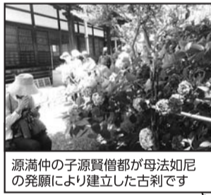
源満仲の子源賢僧都が母法如尼の発願により建立した古刹です