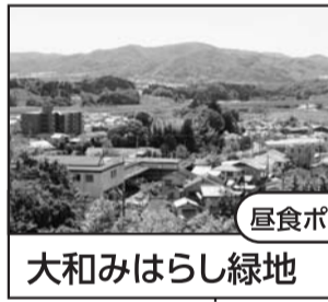
大和みはらし緑地