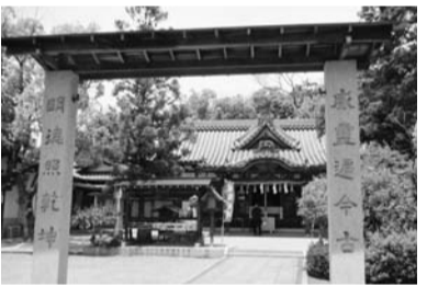
紀元前90年頃の創建といわれ、かつての陶器生産の中心地の守り神として今も信仰を集めている神社です