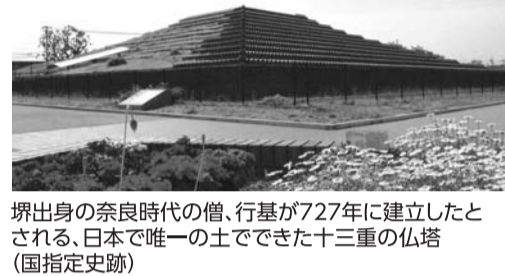
堺出身の奈良時代の僧、行基が727年に建立したとされる、日本で唯一の土でできた十三重の仏塔(国指定史跡)