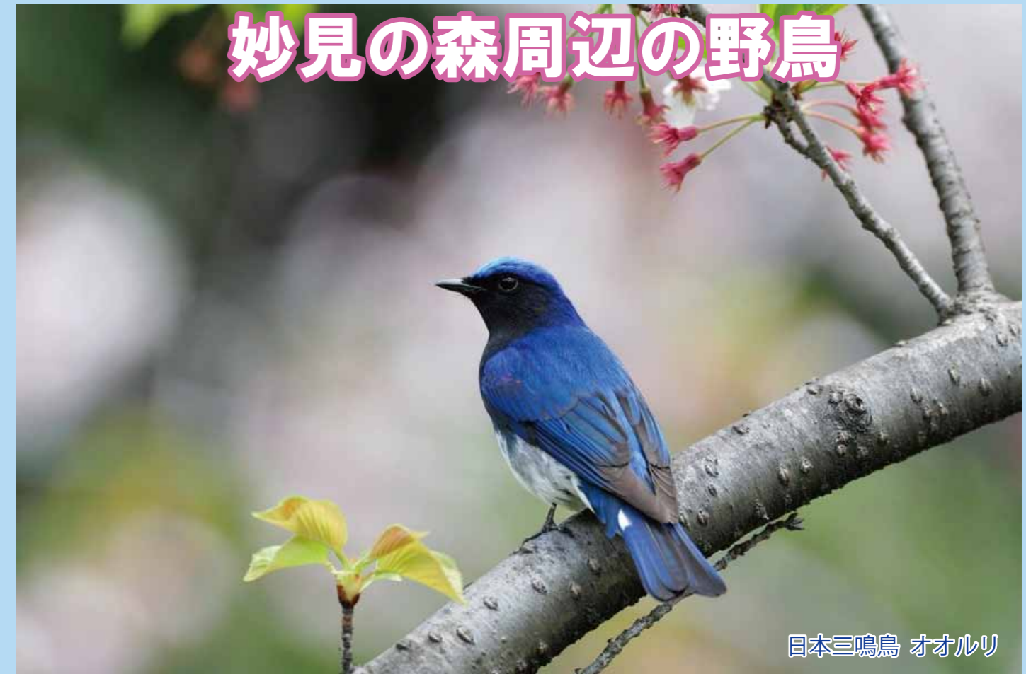
日本三鳴鳥 オオルリ