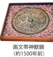
画文帯神鏡 (約1500年前)