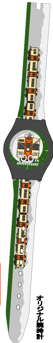
オリジナル腕時計