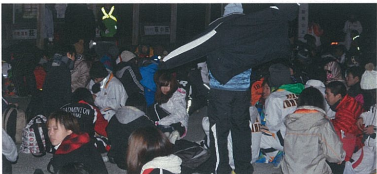
さすがに疲れた…ちょっと一休み。