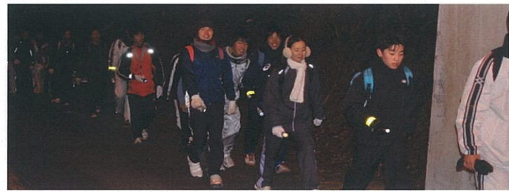
まだまだ元気！夜道を懐中電灯片手に頑張ります