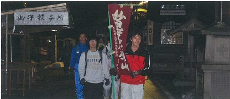
夜行登山の幟を先頭に、妙見山上到着！