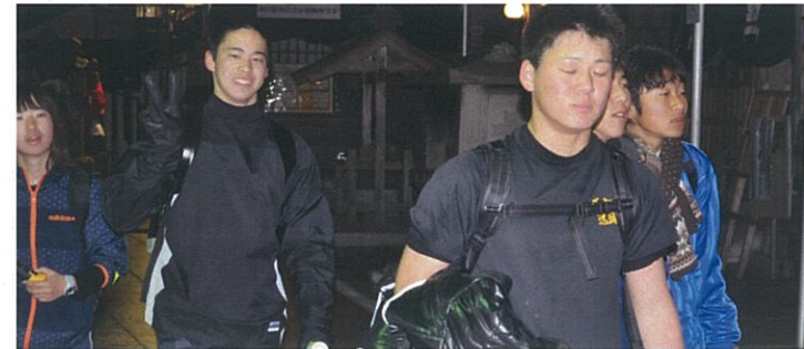
マイナス7℃でも、急な登りで体がポカポカ。