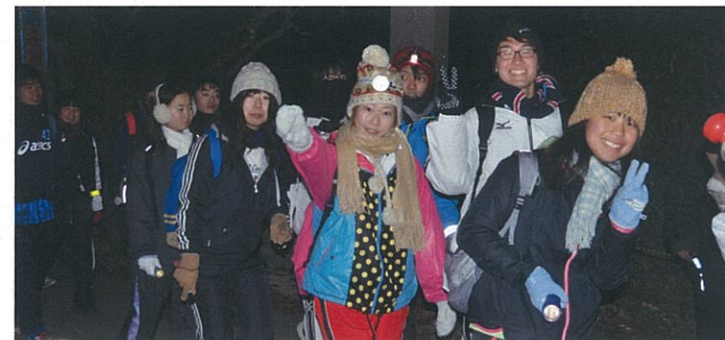
休憩して、体力回復♪まだまだイケるぞ～！