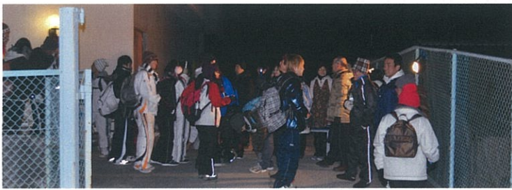
夜食の豚汁を食べて、休憩終了。今から妙見登山！

能勢電鉄では、生徒の皆様を応援する横断幕を準備し、沿道で応援させていただきました。生徒の皆様が頑張っている様子を、少しでもご紹介いたします。