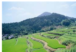
青田が広がる長谷の棚田（6～8月頃）