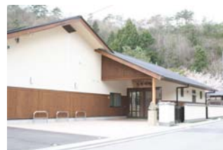
多田銀銅山「悠久の館」 銀山地区の歴史を紹介

能勢電鉄日生中央駅→（阪急バス：川西猪名川線）→銀山口バス停→多田銀銅山「悠久の館」