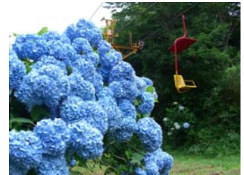
あじさいの上を空中散歩（7月頃）