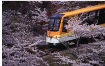
満開の桜を通り抜ける妙見ケーブル（4月頃）

能勢電鉄妙見口駅→（阪急バス：妙見口能勢線）→ケーブル前バス停→（妙見ケーブル・リフト）→能勢妙見山