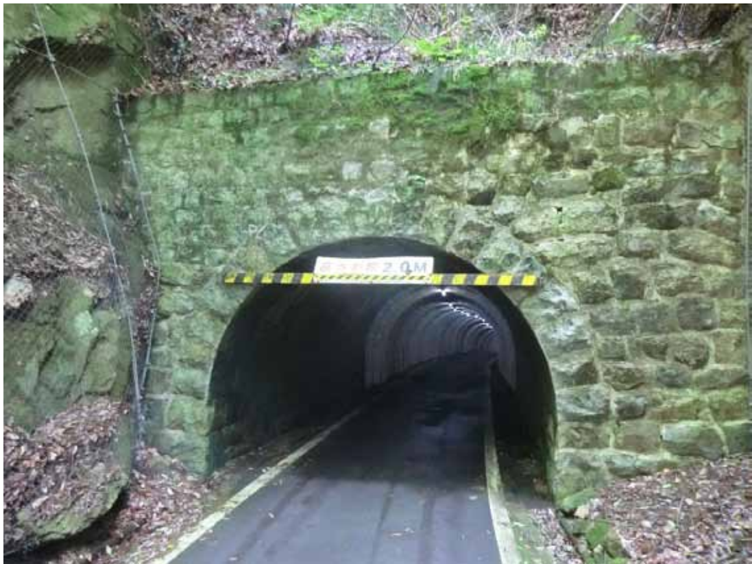
津坂トンネル（通称：くろまんぷ）