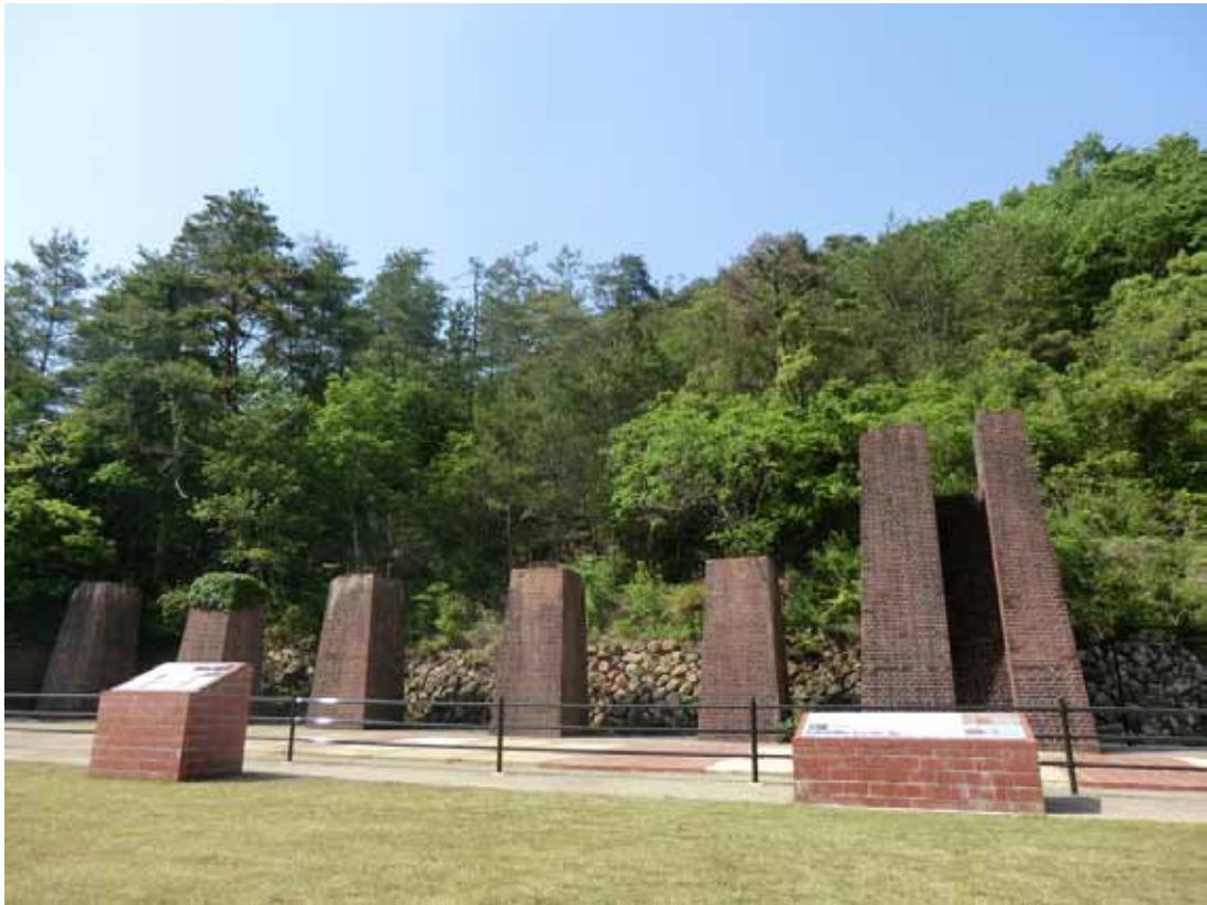
堀家（ほりけ）製錬所跡