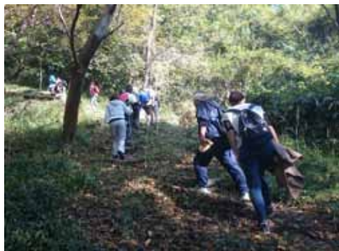
新緑の中をかる〜く山登り