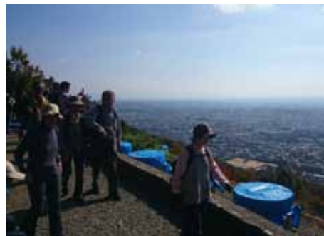
がんがら火祭りの「大」の火床から