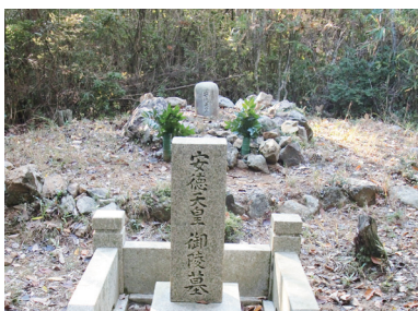
第81代 安徳天皇 陵墓（伝）