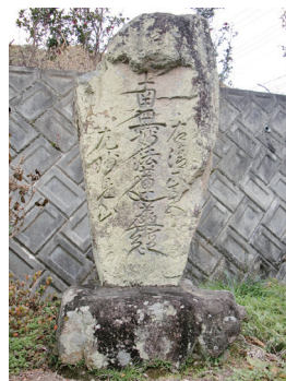
弘化二年（1845）の題目塔

領主 源頼基が山城国北野天神の分靈を背後の歌垣山の頂上に勧請し祀ったのが起源とされ祭神は菅原道真公