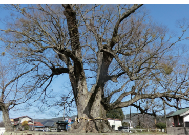
国の天然記念物 野間の大ケヤキ

○お問い合わせ（9:30～17:30、土・日・祝日を除く） 能勢電鉄ハイキング担当 072-792-7716 ○当日の決行・中止のお問い合わせは（午前7時以降） 応答専用ダイヤル 072-792-7227