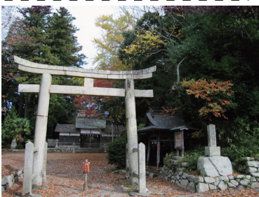
延喜式内社 野間神社

妙見口駅前を出発し大堂越で能勢の野間地区へ。安徳天皇の付き人が代々暮らしたと伝わります。野間川沿いに下ると左手は野間氏の居城跡、右手は野間氏の菩提寺圓珠寺が望めます。野間の大ケヤキでひと休み後は壇之浦の合戦で難を逃れて隠棲したと伝わる幼帝安徳天皇が祀られている陵墓へ。およそ千年前に思いを馳せた後は豊かな田園風景を眺めながら菅原道真公を祀る倉垣天満宮へゴールします。お帰りは最寄りのバス停から妙見口駅へ。バス料金が必要です。【ウォーキングシューズがお勧めです】※7月豪雨と台風の影響で通行止め箇所があり、一部コースを変更しております。