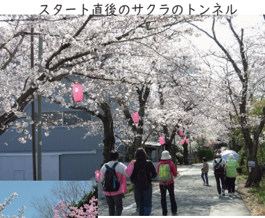
スタート直後のサクラのトンネル