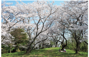
八坂遊園のサクラ

猪名川堤防上のソメイヨシノの並木道から銀橋を渡ります。矢間地区の急坂を上って鶯の森経由で北ひばりが丘公園へ。園内の様々な桜を眺めながら住宅地を進むと宝塚市北雲雀きずきの森です。ここでは野生種の桜の群落が皆さんを迎えてくれることでしょう。川西市街に戻って八坂神社の見事な桜の庭園に感動したら東へ東へ、ビッグハーブ横の桜並木を通り抜け小戸神社の桜の参道を抜けると開業30周年を迎えた川西阪急は目の前です。【ウォーキングシューズがお勧めです】