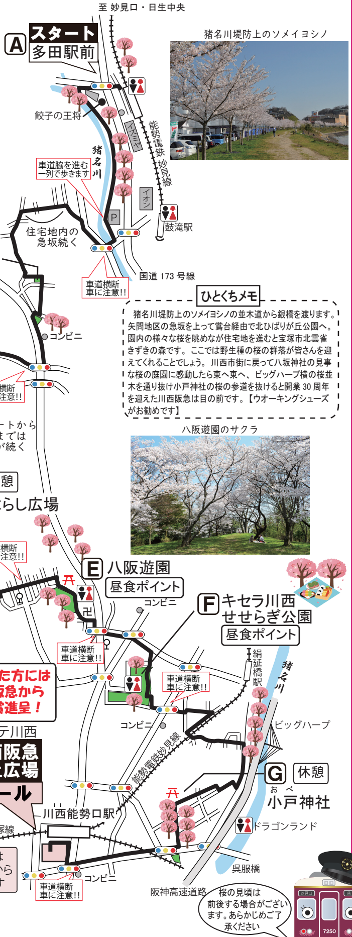
猪名川堤防上のソメイヨシノ