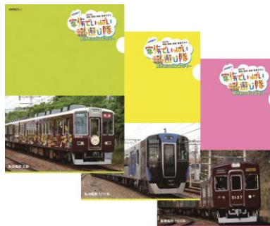
※参加賞：クリアファイル（阪急×3種類、阪神・能勢×各1種類）