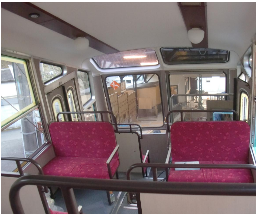
妙見の森ケーブル 2号車 (ときめき) 内装