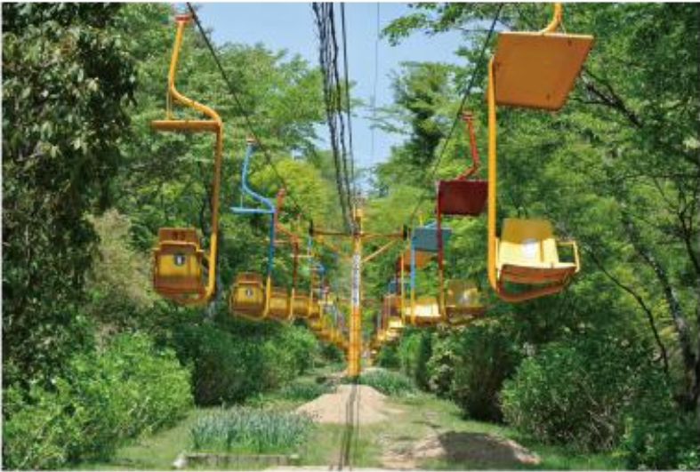
【現行】妙見の森リフト