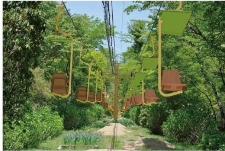
【リニューアルイメージ】妙見の森リフト