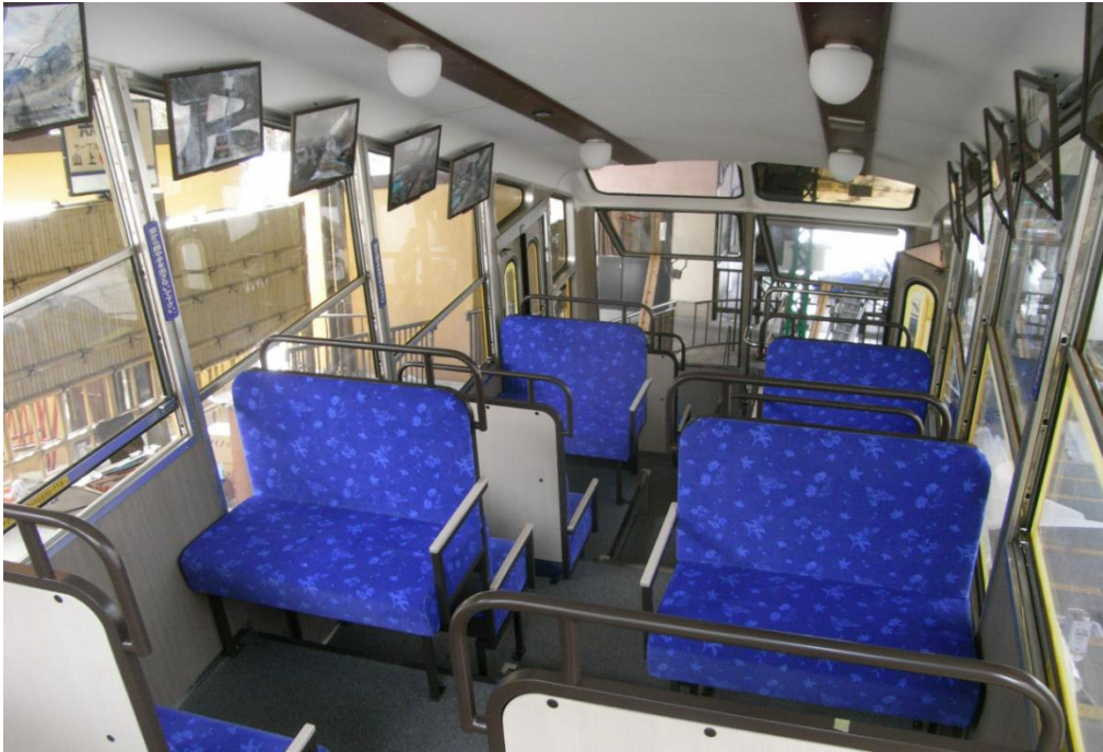
妙見の森ケーブル 1号車 (ほほえみ) 内装