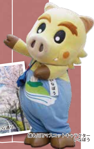
猪名川町マスコットキャラクター いなぼう