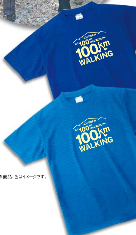
※商品、色はイメージです。

のせでんハイキングに参加してTOTAL100キロ歩かれるともれなくオリジナルTシャツプレゼント!