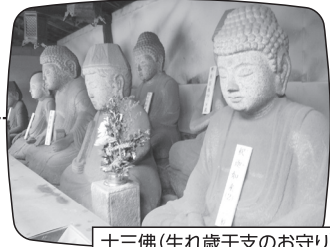
十三佛(生れ歳干支のお守り)