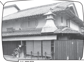
池田屋 住吉街道と熊野街道の 交差点角の店舗の屋根の上には 住吉さんのシンボルの高灯籠が