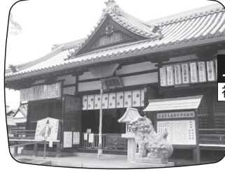
止止呂支比売命神社 神社の中を通る