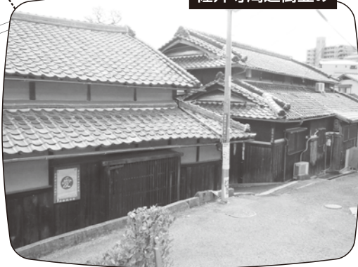
静かに...昔なつかしい日本家屋の間を通ります 佐井寺周辺街並み

南北ウォーク賞 全6回中5回以上参加の方 ※ただし最終回に参加された方のみ 吸収速乾性に優れた ドライTシャツ ※お1人様1枚プレゼント。色は紺のみです。 ※賞品は数に限りがあります。