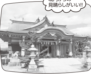
境内からの見晴らしがよい!!