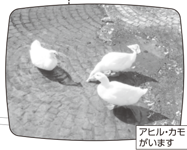
アヒル・カモがいます