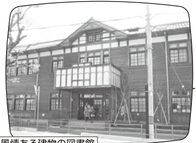
風情ある建物の図書館