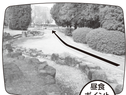
昼食ポイント 佐竹公園