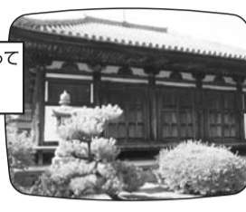
国宝の「観音堂」は釘をつかっていないので「釘無堂」とも大阪府下最古の木造建築