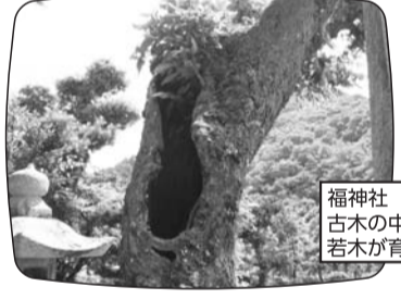
福神社 古木の中から若木が育っています