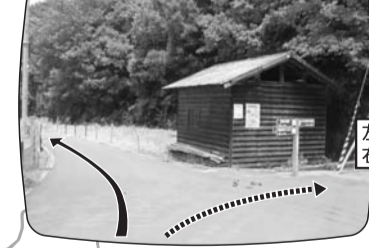
左が本コース、右が自然の家方面