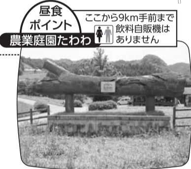
屋食ポイント 農業庭園たわわ ここから9km手前まで飲料自販機はありません