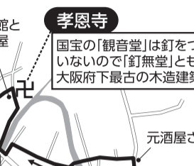
孝恩寺 国宝の「観音堂」は釘をつかっていないので「釘無堂」とも大阪府下最古の木造建築