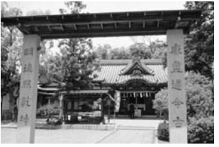
紀元前90年頃の創建といわれ、かつての陶器生産の中心地の守り神として今も信仰を集めている神社です