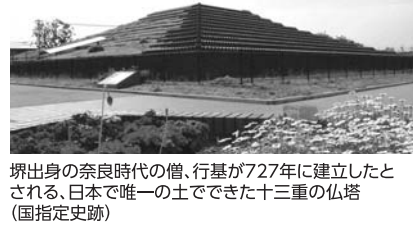
堺出身の奈良時代の僧、行基が727年に建立したとされる、日本で唯一の土でできた十三重の仏塔(国指定史跡)