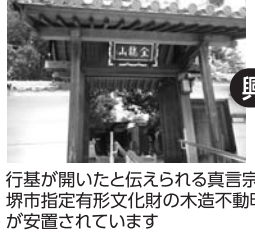
行基が開いたと伝えられる真言宗のお寺 堺市指定有形文化財の木造不動明王立像が安置されています