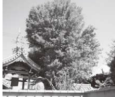
境内には樹齢約300年のイチヨウがあります