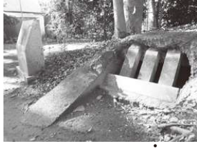
神社の境内には30人ほど避難できる防空壕跡があります