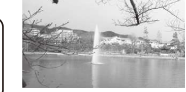
中段の池にある庵は池田市の友好都市「中国・蘇州市」から贈られた苧芳亭です