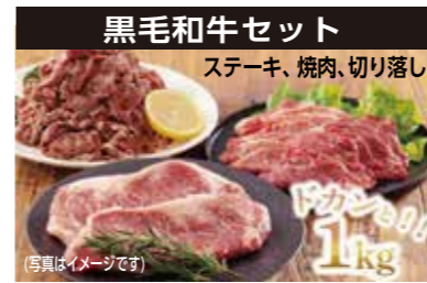
黒毛和牛セット ステーキ、焼肉、切り落とし (写真はイメージです)

▶ イベント当日中、専用二次元コードから応募してください 当選された方に、後日宅配便でお届けします(賞味期限:製造後1カ月)