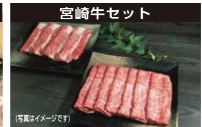
宮崎牛セット ステーキ、焼肉、切り落とし (写真はイメージです)