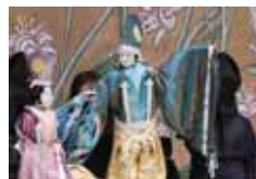
能勢人形浄瑠璃鹿角座公演