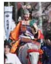
川西市源氏まつり