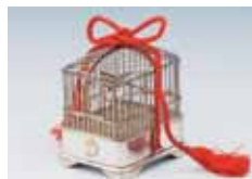
大阪青山歴史文学博物館 所蔵品展