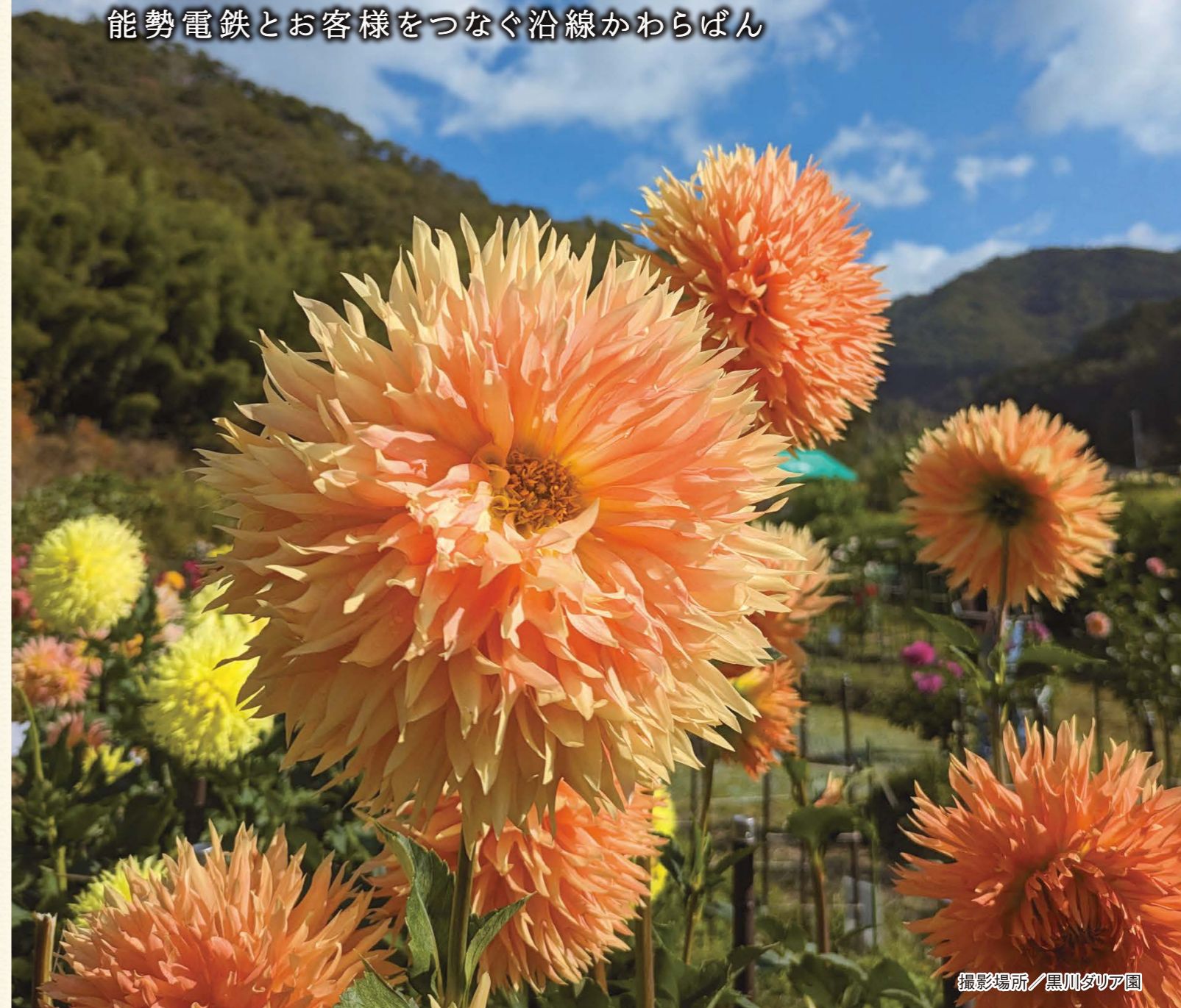
撮影場所/黒川夕ア園