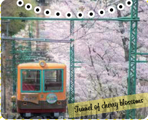
Tunnel of cherry blossoms