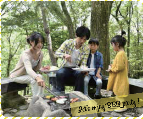
Let's enjoy BBQ party!