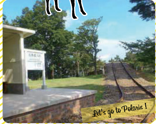
Let's go to Polaris!