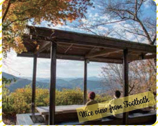
Nice view from Footbath