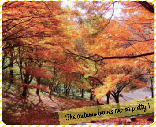
The autumn leaves are so pretty!

※花や自然の状況はその年の天候などによって変わります。あらかじめご了承ください。