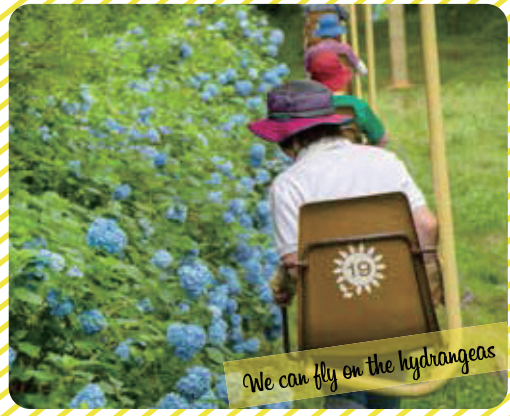
We can fly on the hydrangeas