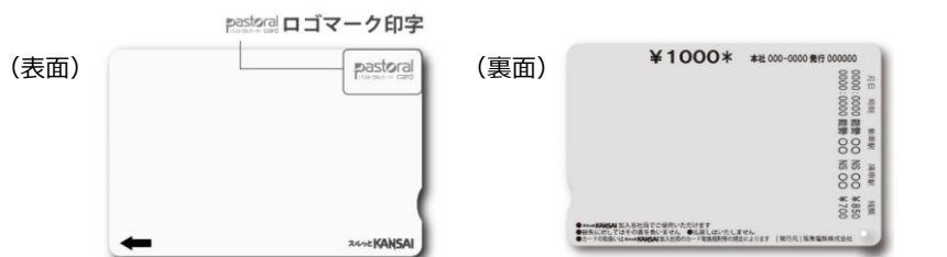
【処理済カード見本】