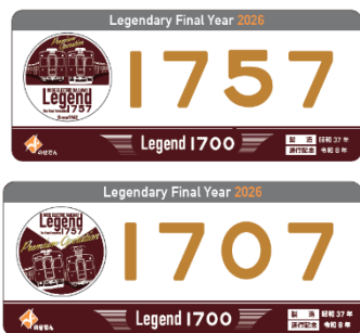
車内掲出プレート (2枚セット) 2,000円

また、のせでんレールウェイフェスティバル 2026 から以下の記念グッズを発売開始します。 <販売グッズ（一部）>