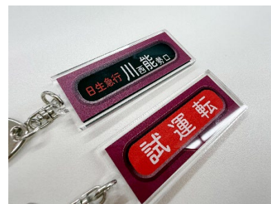
方向幕キーホルダー ブラインド販売（全14種） 600円/個