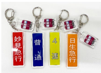
スタッフ用列車種別プレート キーホルダー（全4種） 各1,200円