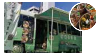
ソラカフェなないろじかん