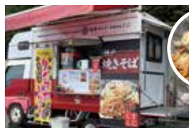
宝塚ダイナース カフェここ