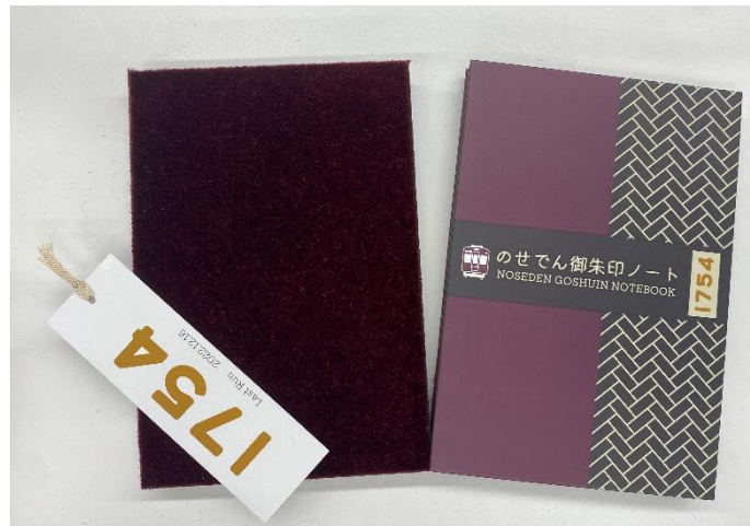
(シート面と付属の専用しおり) (表紙)