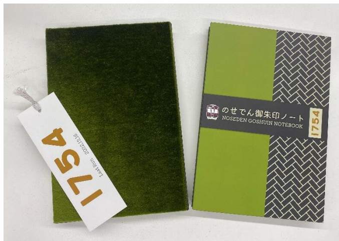
(シート面と付属の専用しおり) (表紙)