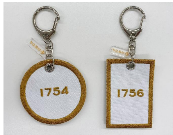
(各キーホルダー裏面)